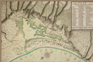
Plan du centre de Saint-Paul en 1720 Échelle de 1:10000

Dans les années 1770, l'exploitation du café nécessite une installation des colons plus marquée sur ce morceau de territoire. Le dynamisme économique qui s'en suit aura pour conséquence la création d'une paroisse le 15 décembre 1776 : Saint-Leu qui devient commune en 1790, tout comme Saint-Paul.