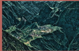
1 - Vue de l'ensemble 1988

Aujourd'hui, des éléments de modernité (sanitaires, électricité, hélicoptère, tourisme, Internet) apparus dans le dernier quart du XX e siècle donnent au cirque de Mafate un nouveau visage combinant modernité et tradition.