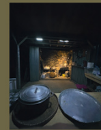
1 - Le tour en est le lieu où se réalisent les pratiques durables 2011