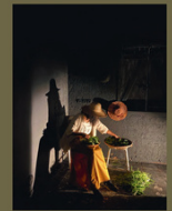
2 - Performances artistiques sur le stage des tricornes 2011